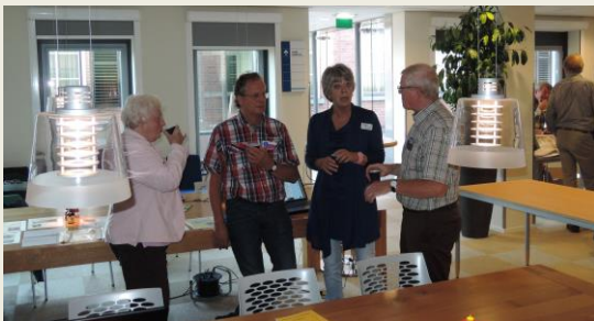
4 okt 2014 te Barneveld

De werkgroep presenteert zich regelmatig bij diverse evenementen. In de afgelopen periode zijn we weer begonnen om tijdens de lezingen van de OV Ermelo een stand te bemannen om u in de